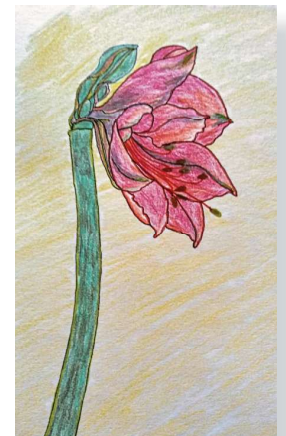
Malgruppe Art 55plus; Künstlerin: Inge