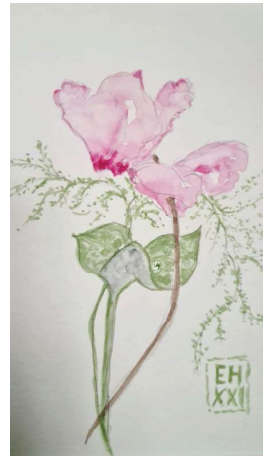
Malgruppe Art 55plus; Künstlerin: Edith