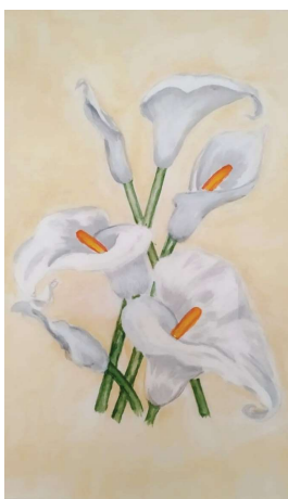
Malgruppe Art 55plus; Künstlerin: Elsa

Zugegeben: ich war nicht so weltfremd, um nicht um mich herum zahlreiche Omas zu erleben, die dem Omaklischee in keiner Weise entsprechen, die fit und