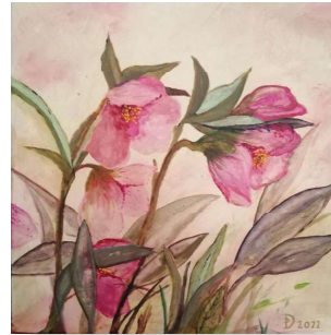
Malgruppe Art 55plus; Künstlerin: Doro