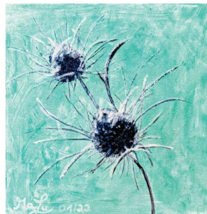
Malgruppe Art 55plus; Künstlerin: Martha

Zum Plätzchenstopp fanden wir ein richtig cooles Tipi, wahrscheinlich von Kindergartenkindern aus Holzpfählen gebaut. Vorsorglich wurden die Plätzchen noch mit einem