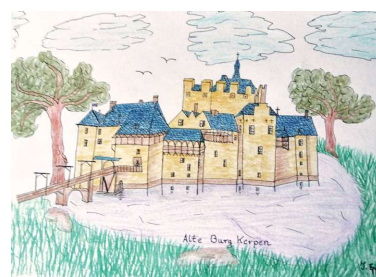
Malgruppe Art 55plus; Künstlerin: Inge