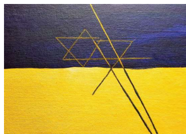
Malgruppe Art 55plus; Künstlerin: Ingrid

Bei der Heimfahrt sind wie immer am Bahnhof alle Info- Tafeln voll ausgefüllt, nur 920 und 941 fahren jetzt nicht, sondern erst in einer Stunde???