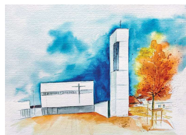
Malgruppe Art 55plus; Künstlerin: Anna

Die gewaltigen Bäume, ihre üppigen Kronen Ihre gezeichneten Stämme, uralte Geschichten erzählend