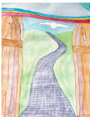
Malgruppe Art 55plus; Künstlerin: Lisa

Weil es so gut geklappt hat nahmen wir 2 Wochen später für die Hinfahrt den Bus